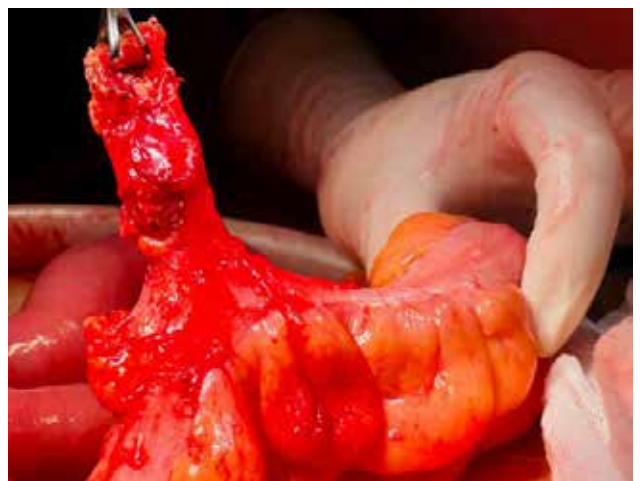
Figura 3. Imagen intraoperatoria. Se aprecia el divertículo gigante y solitario en el colon sigmoide.