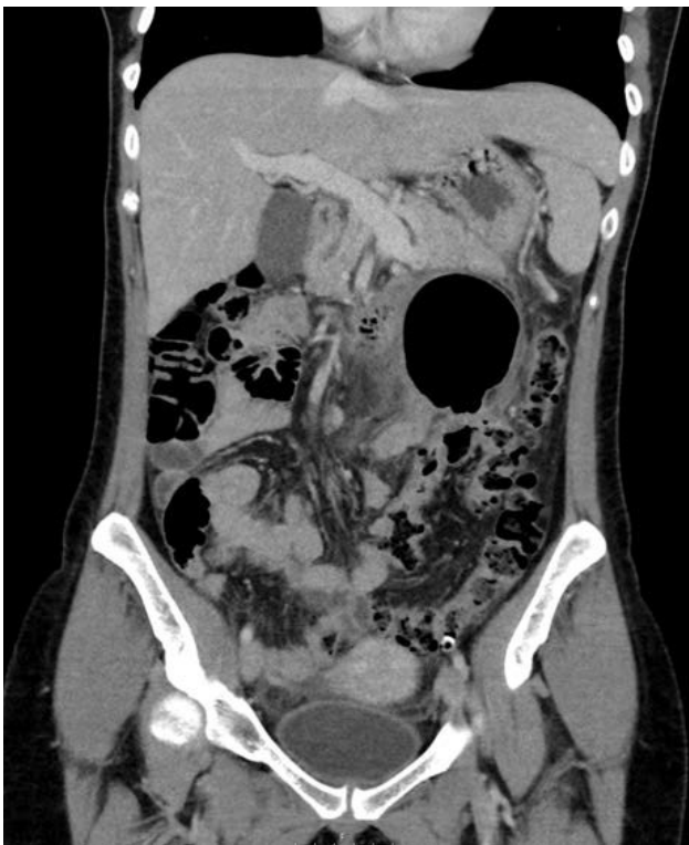
Figura 1. Tomografía computada en la que se aprecia el "signo del Globo". Una gran burbuja área de paredes fina. Sin que se aprecie continuidad con la luz del colon.

El tratamiento de elección es la resección con anastomosis del segmento de colon afectado si no existen complicaciones locales como perforación o absceso. En estos casos, se podría considerar una resección tipo Hartmann.