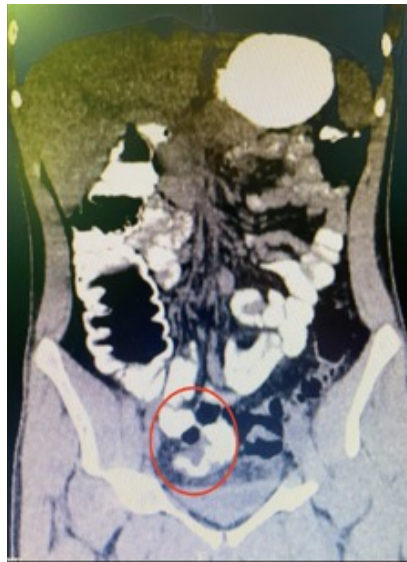
Figura 2. Tomografía abdominopélvica que evidencia la presencia de una estructura tubular en fondo de saco ciego con contraste en su interior, compatible con divertículo de Meckel.

El diagnóstico de abdomen agudo se llevó a cabo mediante el examen físico y estudios complementarios. El hemograma demostró la presencia de neutrofilia. En la totalidad de los pacientes se realizó radiografía de abdomen de pie, observando niveles hidroaéreos de intestino delgado en los casos presentados con síntomas obstructivos. En 6 casos se realizó ecografía abdominal, que evidenció escaso líquido libre en fosa iliaca derecha. Solo en 2 pacientes con sospecha de divertículo de Meckel complicado se solicitó una tomografía abdominal que certificó el diagnóstico. El primero era un paciente de 67 años que consultó por dolor centroabdominal y vómitos de 2 días de evolución, sin respuesta al tratamiento médico. La tomografía evidenció la presencia de un saco diverticular de características inflamatorias dependiente del intestino delgado, asociado a niveles hidroaéreos marcados. El segundo corresponde a un joven de 17 años que consultó por guardia por episodios de hematoquezia de 36 horas de evolución, con repercusión hemodinámica, en el cual la videocolonoscopia no evidenció sangrado colónico. La tomografía mostró un fondo de saco ciego a expensas del intestino delgado con presencia de contraste en su interior (Fig. 2).